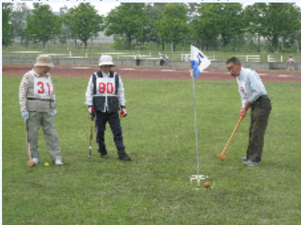
年金友の会グラウンドゴルフ大会

年金友の会では、会員の健康保持増進と親睦を図ることを目的に、グラウンドゴルフ大会・ゲートボール大会を毎年開催しています。