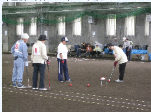
年金友の会ゲートボール大会

年金友の会では、会員の健康保持増進と親睦を図ることを目的に、グラウンドゴルフ大会・ゲートボール大会を毎年開催しています。