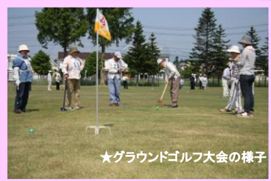
★グラウンドゴルフ大会の様子