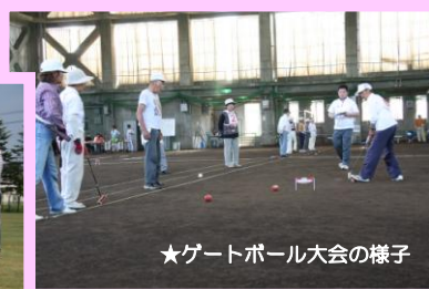
★ゲートボール大会の様子